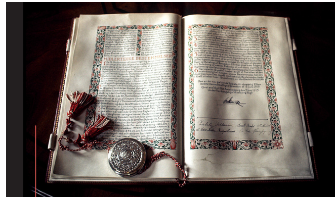
Danmarks Riges Grundlov. Her ses udgaven fra 1915, som blandt andet var med til at give kvinder stemmeret. Den nuværende grundlov er fra 1953.

Siden den første grundlov blev vedtaget den 5. juni 1849, har grundloven dannet rammen om vores demokrati. Grundloven er med til at sikre et stabilt politisk system baseret på demokratiske principper, hvor magten er fordelt mellem flere aktører, så en enkelt person, institution eller et enkelt parti ikke sidder inde med hele magten i samfundet.