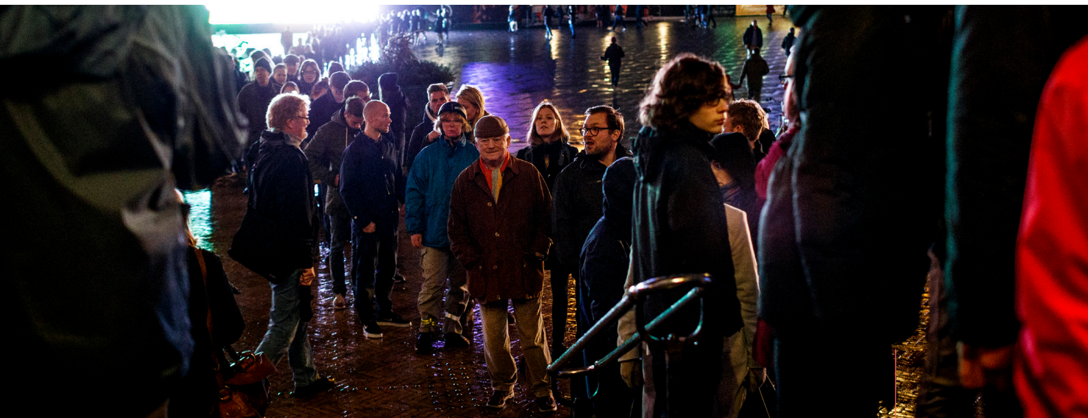
Borgere afgiver deres stemme, 2013.

I Danmark har vi et repræsentativt demokrati, hvilket vil sige, at vi som befolkning vælger politikere til at repræsentere os og træffe beslutninger på vores vegne. Det kaldes også for indirekte demokrati. Ved direkte demokrati er den enkelte dansker med til at træffe politiske beslutninger direkte ved at stemme ved en folkeafstemning.